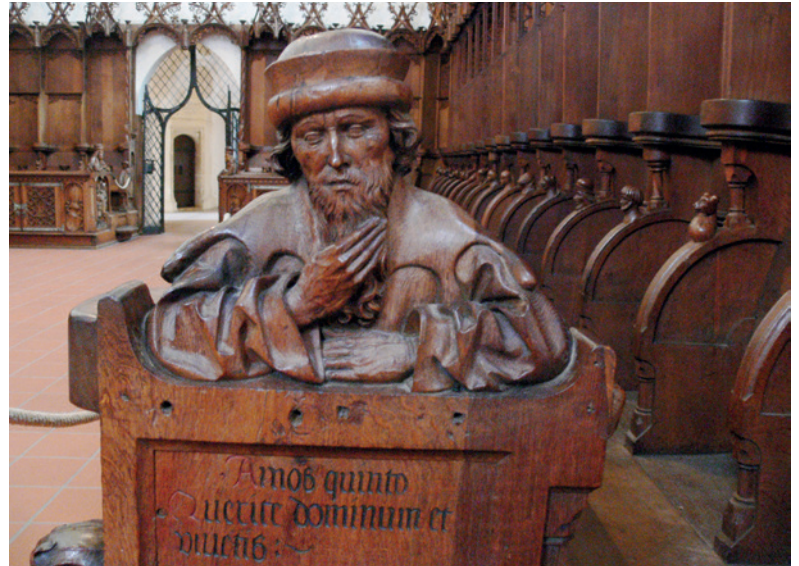
Chorgestühl Blaubeuren, Der Prophet Amos, Jörg Syrlind d. J., 1493

zareth mit Menschen, die voller Sehnsucht nach Hilfe und Heilung waren, gehören dazu. Doch die Bibel nutzt das Bild des fließenden Wassers nicht nur für Leben und Wachstum, sondern auch für etwas Unverzichtbares: Recht und Gerechtigkeit. Wie Wasser sollen sie strömen – unaufhaltsam, lebendig und für alle zugänglich.