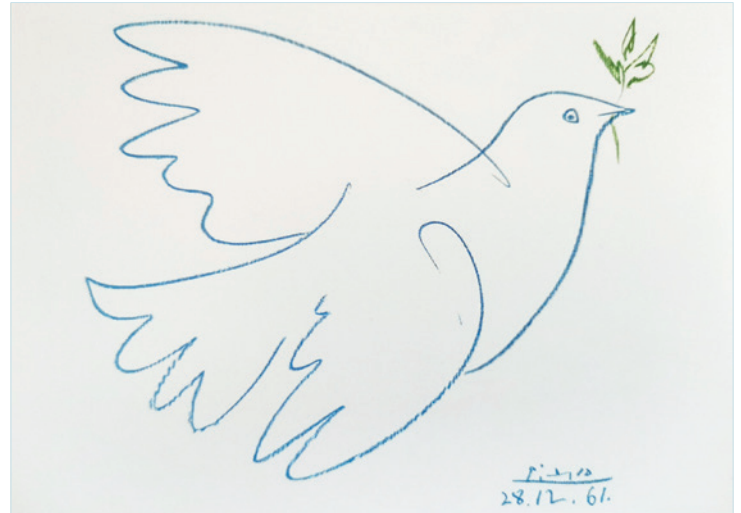
Pablo Picasso, 1961

Strömung. Er verhindert das Abtreiben. Das Wasserfahrzeug bleibt durch die Wirkweise des Ankers am Platz.