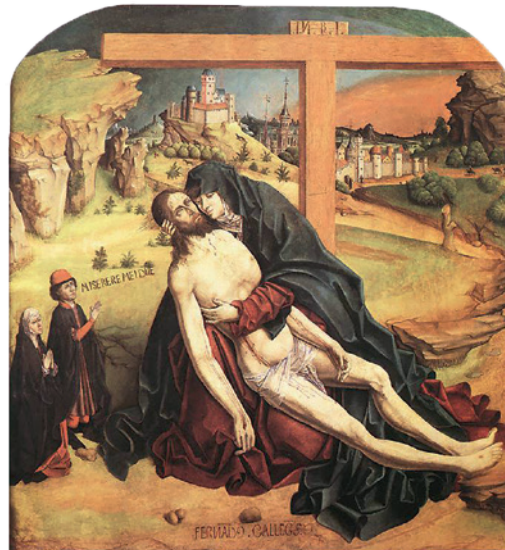
Pietà, 1470, Fernando Gallego